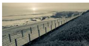
UM PÉ NA TERRA, OUTRO NO MAR

Não tarda nada, teremos em mãos a escolha política que mais interfere com a nossa vida quotidiana – lá para finais de Setembro, seremos chamados a escolher quem vai gerir as nossas freguesias (12, de novo) e o nosso município. E como estamos em final do ciclo político (com a impossibilidade de recandidatura do atual presidente da câmara e de vários presidentes de juntas de freguesia – além de estas voltarem a ser, de novo, 12), o próximo ato eleitoral reveste-se de acrescido interesse, pois a mudança de ciclo é sempre uma janela de oportunidade e de esperança para as forças políticas concorrentes, que se apresentam com estatutos diferentes e que, portanto, vão ser objeto de diferente julgamento por parte dos concidadãos: o PSD, enquanto partido incumbente, será julgado não apenas pelo que propõe (projeto e equipa para o concretizar), mas igualmente pelo grau de satisfação que os eleitores têm relativamente ao seu de-