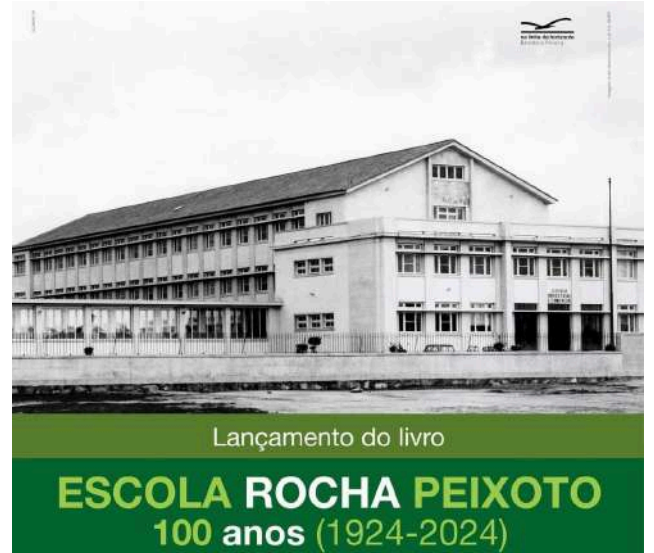
Lançamento do livro

Claro que nem todos para cá vieram pelo facto de nas suas terras não disporem deste tipo de ensino – alguns preferiram a Póvoa por já cá terem retaguarda familiar. (A Póvoa já era, de há muito, a “menina” dos olhos de gente de muitos quadrantes, sobretudo do interior norte, inicialmente por razões balneares, entretanto também por outras).