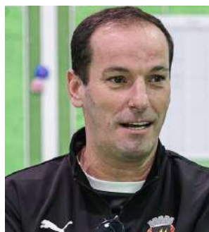
PETIT ENTRA A VENCER (P18)