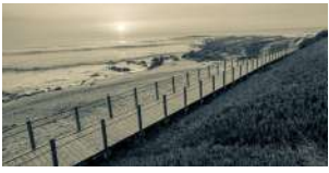
UM PÉ NA TERRA, OUTRO NO MAR

No último domingo (10 de Novembro), a Escola Secundária Rocha Peixoto assinalou, em muito participada sessão solene, o seu 1º centenário. E, entre atos comemorativos de mui diversa natureza, incluiu o lançamento de um livro, que a Câmara Municipal editou (é o n.º 35 da “Biblioteca Poveira – Na Linha do Horizonte”) – livro que, em densas 230 páginas, nos dá a conhecer o percurso de um projeto educativo em que a Póvoa foi pioneira na região, acompanhando a sua itinerância física e sobretudo a dinâmica humana que o impulsionou. Este documento histórico, cuja leitura não interessa apenas a quem teve (ou tem) qualquer relação com aquela Escola, mas a quantos se interessam pela história da Póvoa (pois a relação escola-cidade é, a vários títulos, inquestionável) – este documento, dizia, só podia ter saído da pena de alguém que, por uma profunda ligação (profissional e emocional) àquela Escola, quis conhecer (e, naturalmente, partilhar connosco) o seu passado, tão próximo e tão distante. (Sim, que cem anos na vida desta Escola, como os também recentes 75 anos