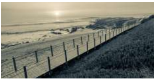
UM PÉ NA TERRA, OUTRO NO MAR